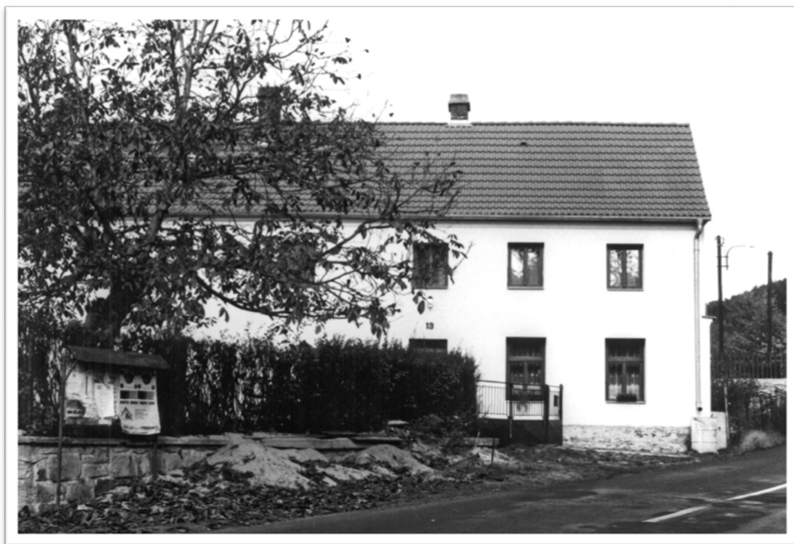
Horní Vysoké, 2004