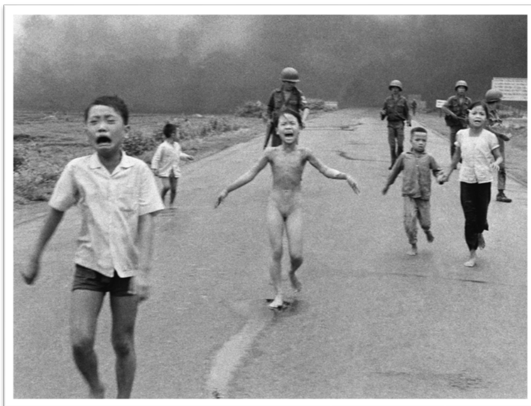
Napalm Girl, 8. června 1972. Snímek zachycuje situaci po náletu jihovietnamského letectva na vesnici Trang Bang. Dívka Kim Phuc je popálena napalmem.