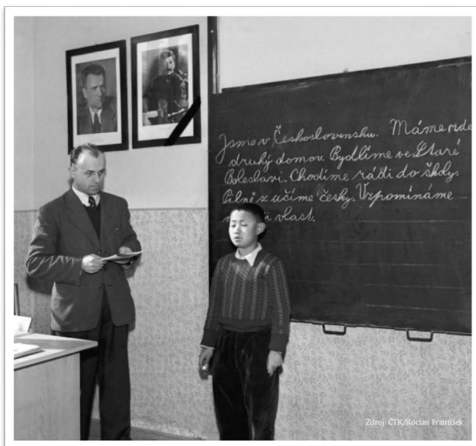
Fotografie z 12. 3. 1953

Dataci nemají žáci k dispozici. Mají k dispozici popisek z databáze České tiskové kanceláře: Československá vláda pozvala do Československa na 200 korejských dětí, které jsou umístěny v lázních Houštka u Staré Boleslavi. Mezi dětmi jsou i partyzáni s vyznamenáním za statečnost. Na snímku hodina vyučování.