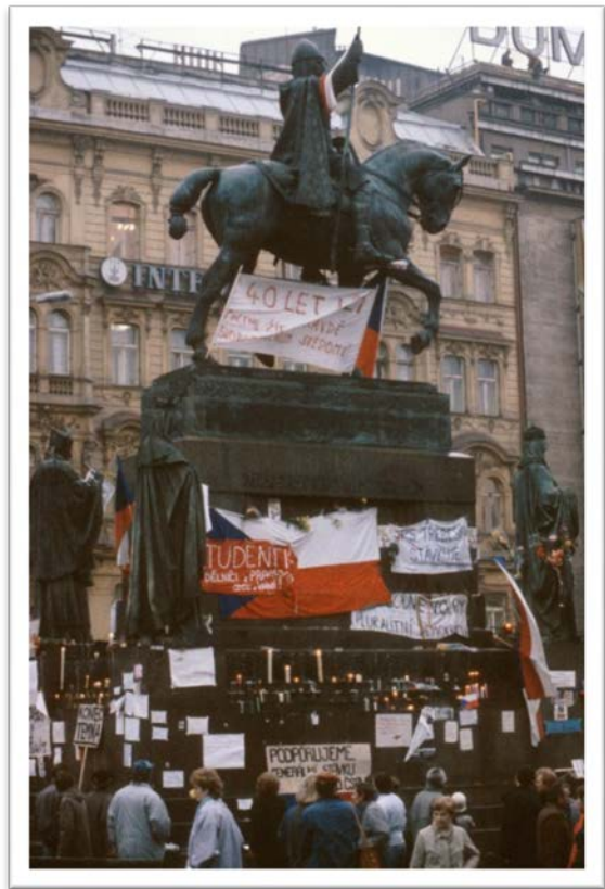
Václavské náměstí 22. 11. 1989