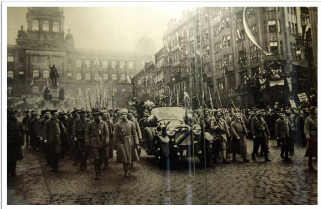
Příjezd T. G. Masaryka do Prahy na podzim 1918