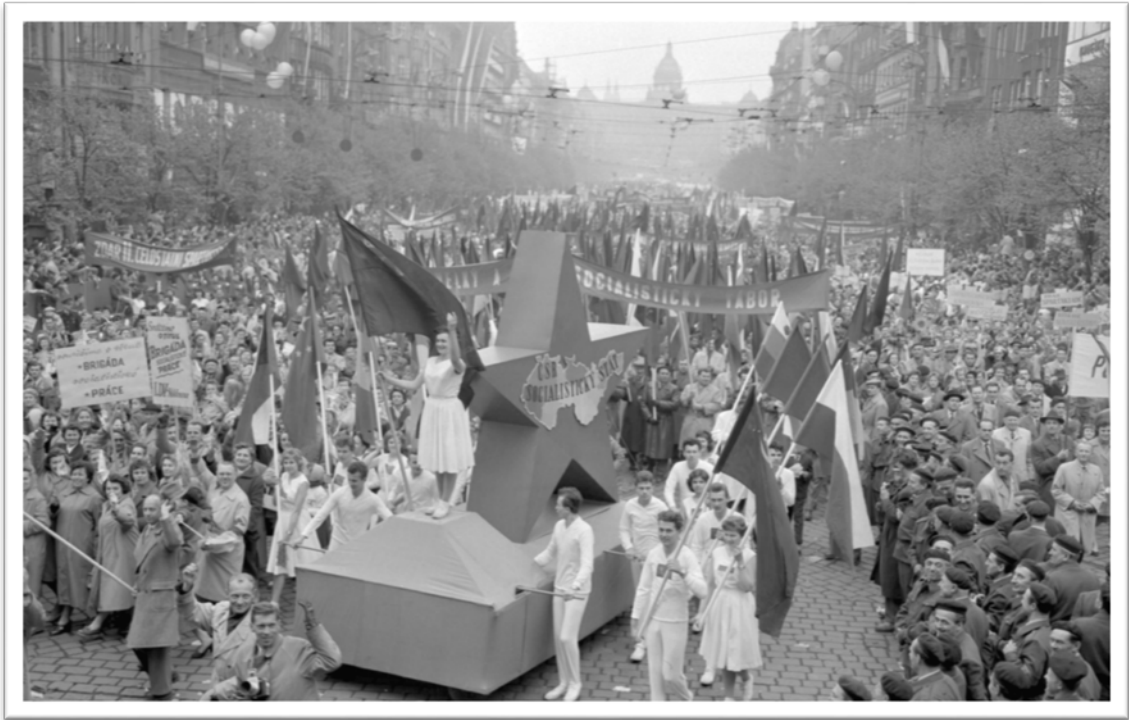
1. máj 1960 - průvod - alegorický vůz