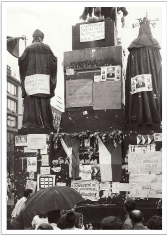
Pomník sv. Václava ve dnech po sovětské invazi 21.8 1968